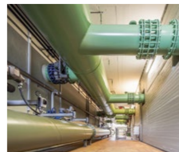
Rohrverteilung zum Sandfilter