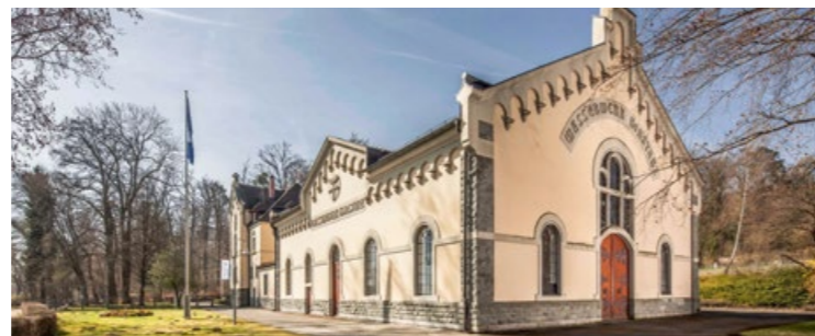
Seewasserwerk in Konstanz-Staad