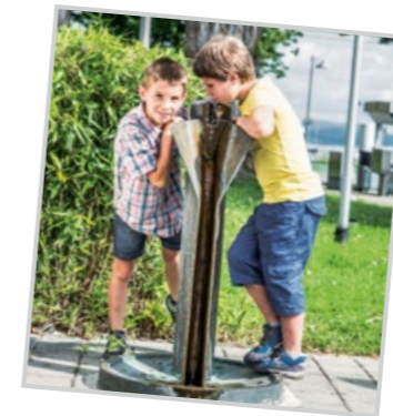
an der Autofähre in Staad