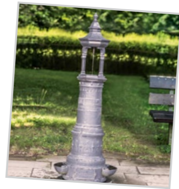
am Wasserwerk in Staad