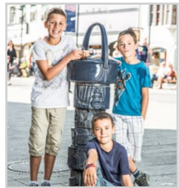
auf der Markstätte

Die vollständige Trinkwasseranalyse gibt es hier: www.stadtwerke-konstanz.de/trinkwasser