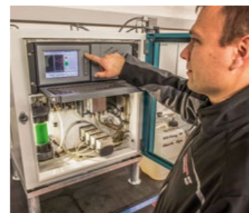
Biomonitor zur Überwachung der Wasserqualität