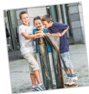
auf dem Augustinerplatz